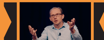
Pieter Both PAG 27